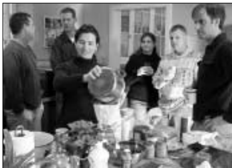
Speelgroep 2003 ouders in de keuken

De afgelopen paar jaar heb ik met veel plezier de Nederlandstalige speelgroep gecoördineerd. Dat hield niet al te veel in; het bestand van adressen bijhouden, maandelijks een email sturen aan de organisator en tijdig de speelgroepers laten weten dat we behoefte hadden aan nieuwe gastgezinnen.